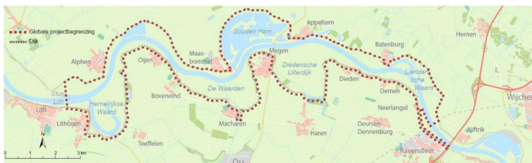
Figuur 1 Plangebied Meanderende Maas

In hoofdstuk 2 licht de Commissie de aandachtspunten voor het vervolgtraject toe.